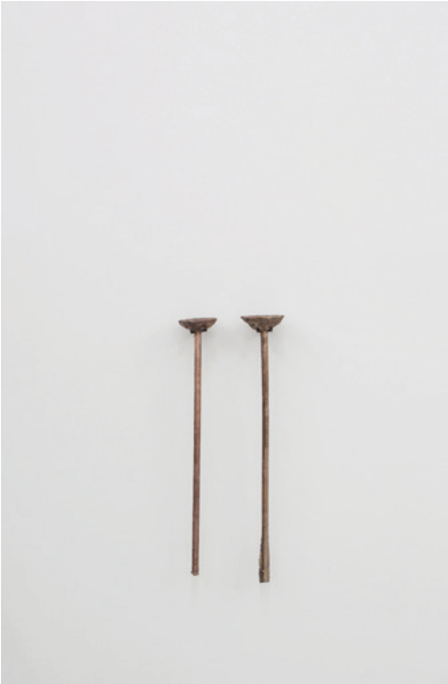
Wachstum und Niedergang in Bronze gegossen 2011 Bronze, Holz 80 × 40 × 17 cm