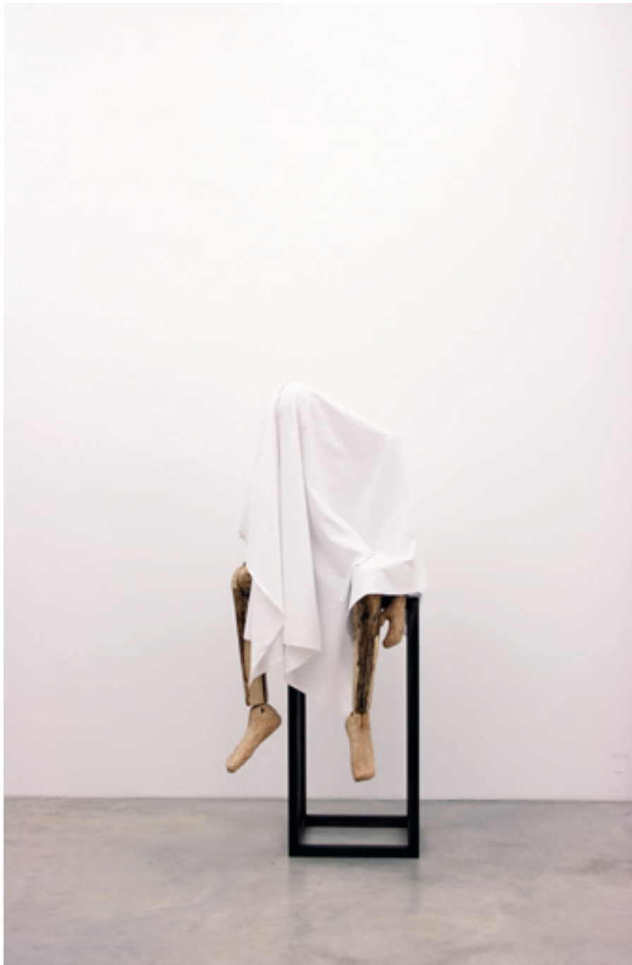
Gliederpuppe (traurig) 2010 Holz, Stoff, Stahl 180 × 75 × 75 cm