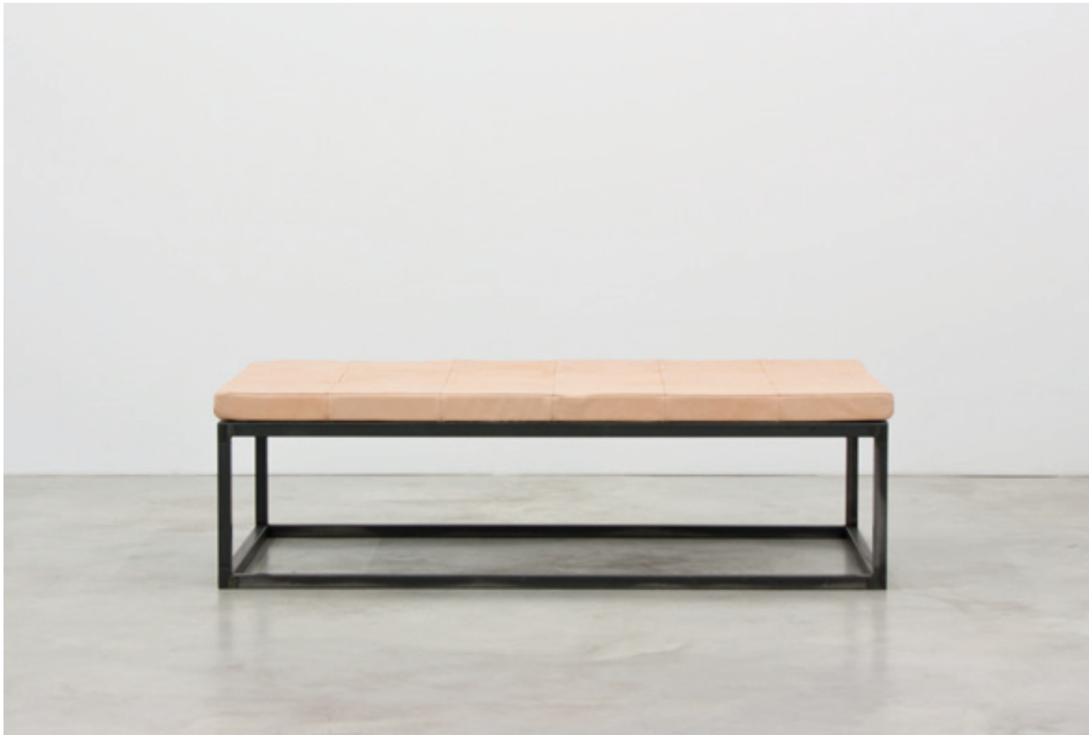
pedestal for a muse 2011 Leder, Schaumstoff, Stahl 57 × 200 × 100 cm