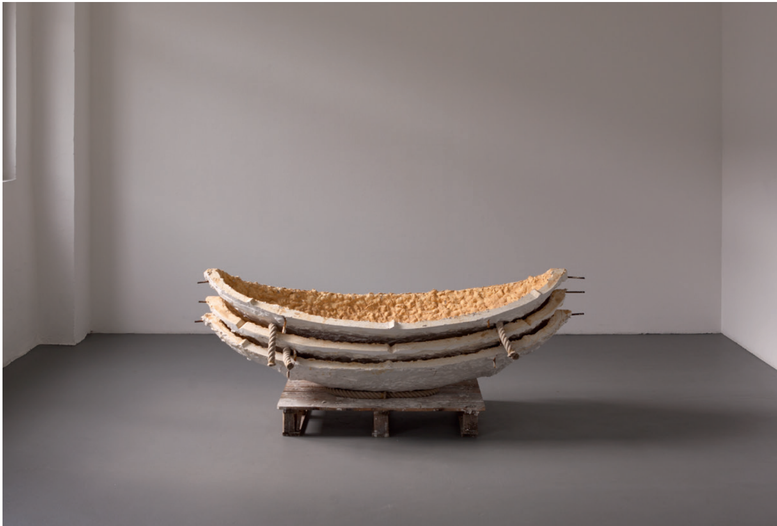
verlorene Form (giving shape to a dim feeling) 2011 Gips, Stahl, Tauwerk, Holz / plaster, steel, cordage 100 x 190 x 90 cm