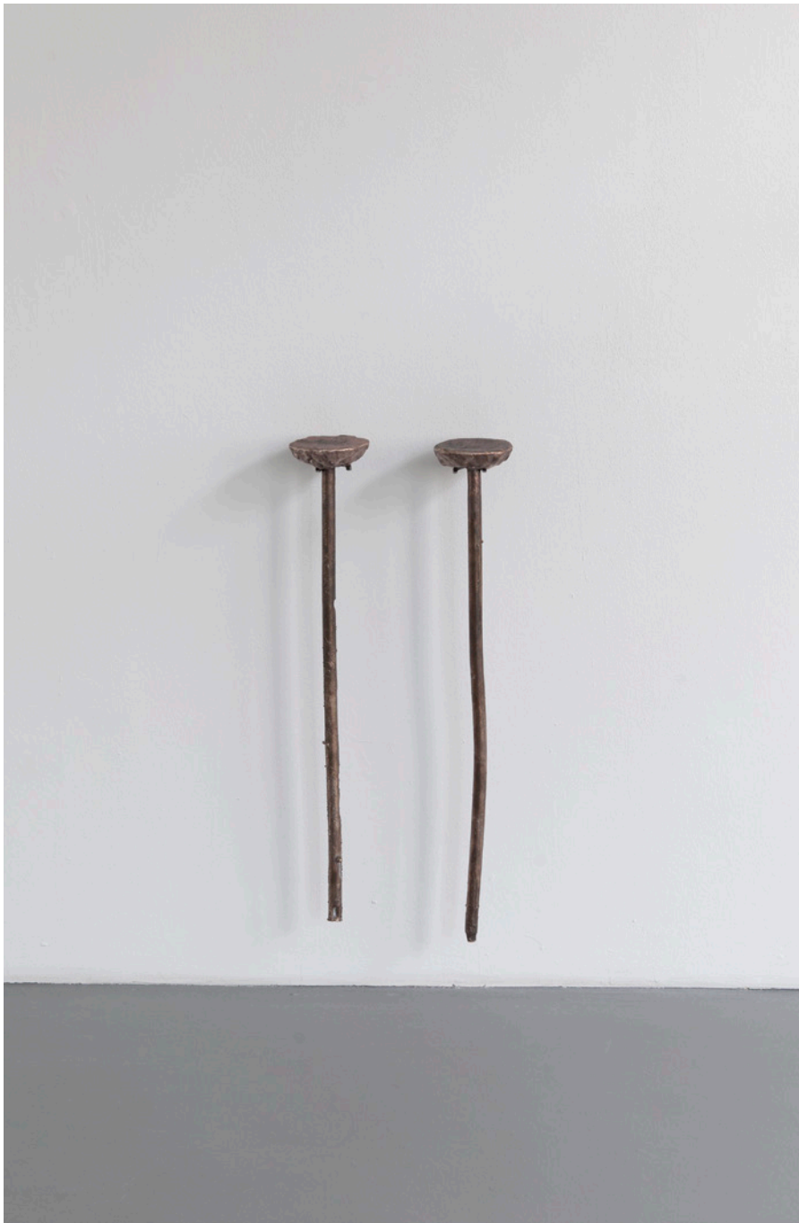
Sprache und Inkonsistenz in Bronze gegossen 2011 Bronze, Stahl / bronze steel 80 x 35 x 17 cm