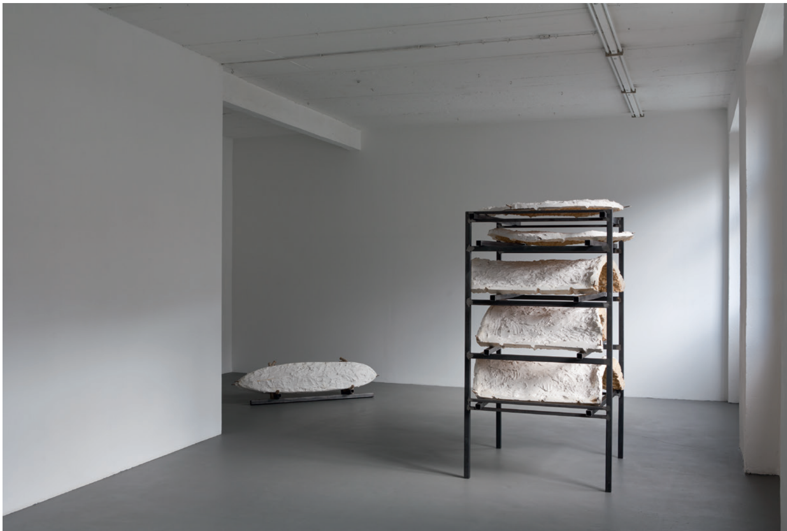
verlorene Form (giving shape to a dim feeling)