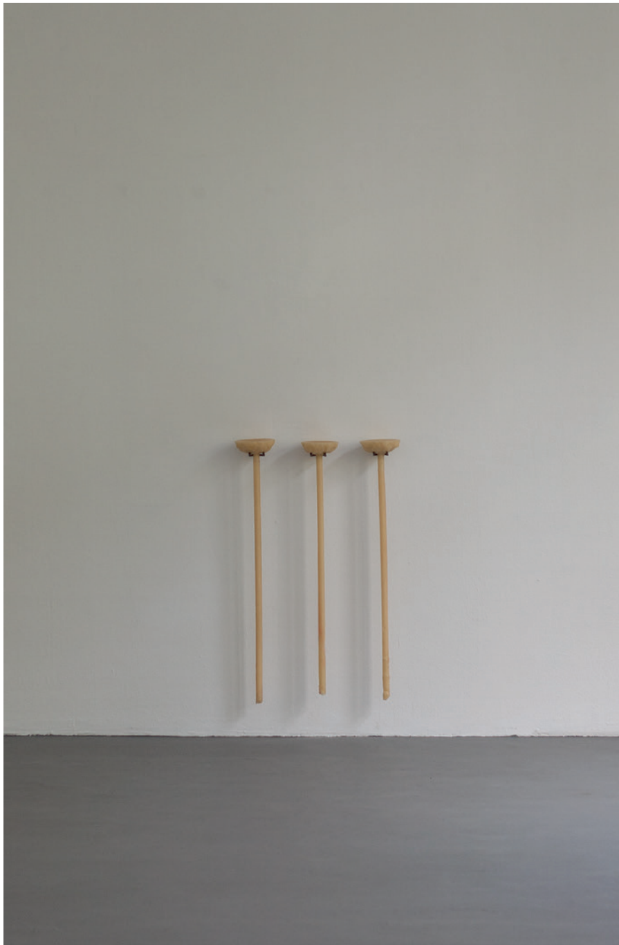
love, trust and loyalty to be cast in bronze 2011 Wachs, Stahl / wax, steel 80 x 55 x 17 cm