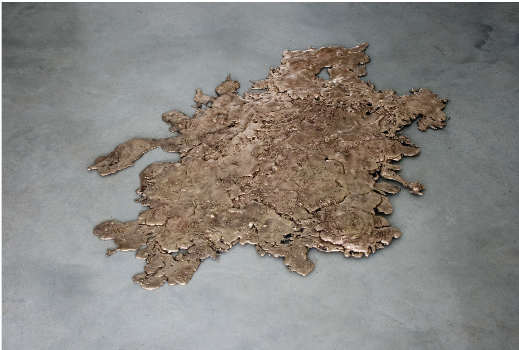
Bronzeguss 2009 Bronze 3 × 132 × 90 cm