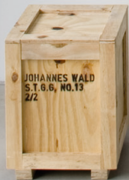
ohne Titel (studying the greeks' grace #13) 2010 silver gelatin print, plaster, steel, wood, spraypaint 113,8 × 93,8 cm (photo) 45,5 × 34,5 × 34,5 cm (crate)